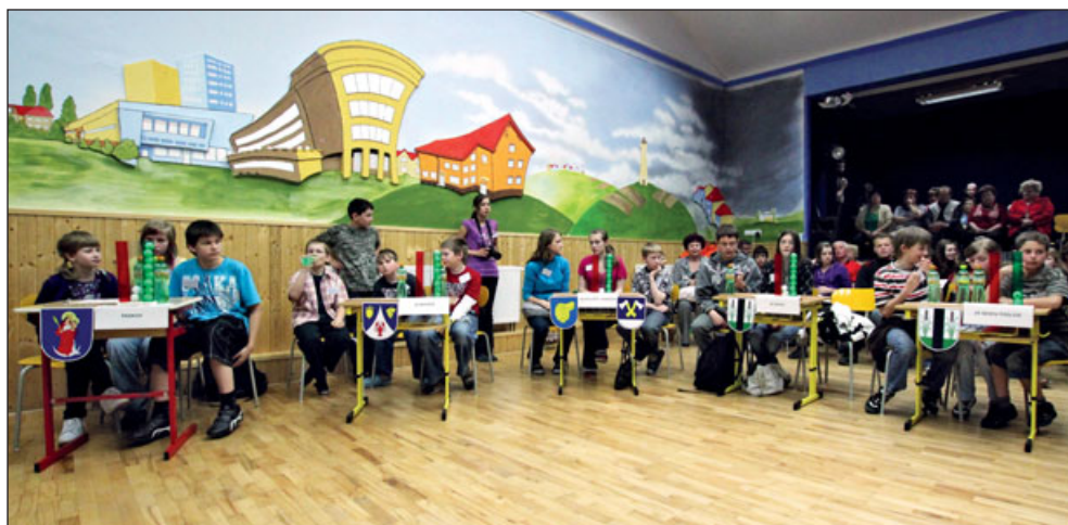
Z 1. ročníku vědomostní soutěže konaného v prostorách Domu dětí a mládeže ve Vratimově, 29. dubna 2010

Raškovice Raškovický čtvrtmaraton a v roce 2018 městem Paskov Paskovská devítka. Závody jsou určeny pro všechny věkové kategorie od dětí předškolního věku až po seniory a od počátku jsou zařazeny do cyklu běžeckých závodů okresu Frýdek-Místek, účastní se ho ale také zájemci ze širšího okolí, včetně blízkého polského příhraničí.