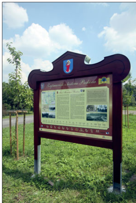
Jedna z tabulí informačního systému Zajímavosti z historie Paskova, r. 2013

Mezi tyto menší investiční akce patřilo vybudování informačního systému vlastní cyklostezky, jež zahrnuje jak tabule věnované jednotlivým obcím, tak i tabule technických zajímavostí v jejím bezprostředním okolí, např. Slezskému náhonu ve Vratimově, pasovému dopravníku na odval Dolu Paskov, Stolbergovu jezu na řece Ostravici nebo železničním mostům přes Ostravici na Důl Paskov a na tehdejší Biocel Paskov, nyníšší Lenzing. Dalším projektem byl turistický informační systém představující tabule o každé obci. Mají jednotné konstrukční řešení i grafický styl a nabízejí základní informace o historii, památkách, atrakcích i zeměpisných charakteristikách a společenském dění představovaných sídelních lokalit. K samostatnému