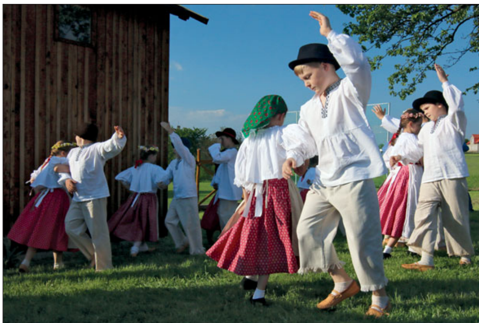
Z vystoupení dětského folklorního souboru Paskovjanek při soutěži v kosení trávy u dřevěného mlýnku v Řepištích, 26. května 2017

existovat díky podpoře svých obcí. Činnost obou podpořil také RSB při pomoci se zpracováním žádosti o dotace, které pomohly získat důležité prostředky na vybavení hudebními nástroji nebo kroji.